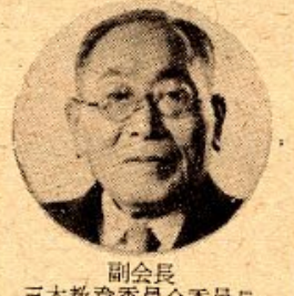
副会長 三木教育委員会委員長