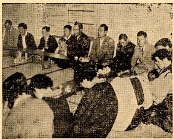
【写真は総会で研究協議中の組合員さん達】