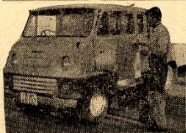
【写真は税務課に配備された小型四輪車】

去る11月4日、税務課に小型四輪自動車三台が配備されました。この車は、一九六〇年型の「トヨエース」で、車体の前半部分が座席で六人乗り後半分の荷台には八五〇kgの荷物が積めます。値段は五〇万円でした。