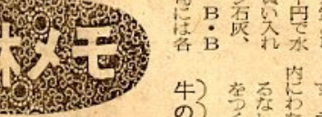
○…市内の畑作農家に大きなダメージを及ぼしているのがネマトーダ(土壌線虫)です。防除は昨年からの補助でやっていますが、これも十五年度補助の割当があり、中野、千本、賀茂、末恒、松原の五地区を三町歩つづつやります。反響は、

○…水相の病虫害防 市では七十七万五千円で水相病虫害防除の農薬を買い入れます。農薬は、ゼンサン石炭、マラン粉剤、開孔剤、B・B粉剤が主で、五月上旬には各農事組合に配布をお渡しします。 病虫害の予防には、早期の手配が必要で、今後とも積極的連絡、通報にご協力をお願いします。 ネマトーダ ○…市内の畑作農家に大きなダメージを及ぼしているのがネマトーダ(土壌線虫)です。防除は昨年からの補助でやっていますが、これも十五年度補助の割当があり、中野、千本、賀茂、末恒、松原の五地区を三町歩つづつやります。反響は、