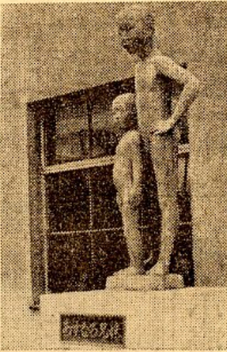
★またこの日の八日は母の日、十三日は万母の日、楽しい、偉大なお母さんのご苦労に感謝の気持ちをこめて、お母さんの健康と幸福を祈りましょう。

★五月五日は「こどもの日」である。昭和二十六年に児童福祉法が制定され、こどもの権利を保障し、明るく丈夫に育てようという趣意でこの日が定められた。この日は新暦の端午(端午)の日といふこと、これがいつのまにか五月五日に定まってきた。こどもの日、家の家、明るく、健康に育てよう(児童福祉法第五十五条第一項)。 ★五月五日はこどもの日、昭和二十六年に児童福祉法が制定され、こどもの権利を保障し、明るく丈夫に育てようという趣意でこの日が定められた。この日は新暦の端午(端午)の日といふこと、これがいつのまにか五月五日に定まってきた。こどもの日、家の家、明るく、健康に育てよう(児童福祉法第五十五条第一項)。