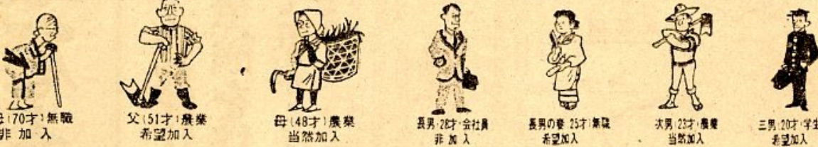
祖母(70才)無職 非加入、父(51才)農業者 希望加入、母(48才)農業者 当然加入、長男(2才)会社員 非加入、長男(25才)農業者 希望加入、次男(23才)農業者 当然加入、三男(20才)学生 希望加入

〇〇円から四二、〇〇〇円まで(ただし、ありませ)支給されます。 ※わしいことは、「老齢年金早見表」をらんください。