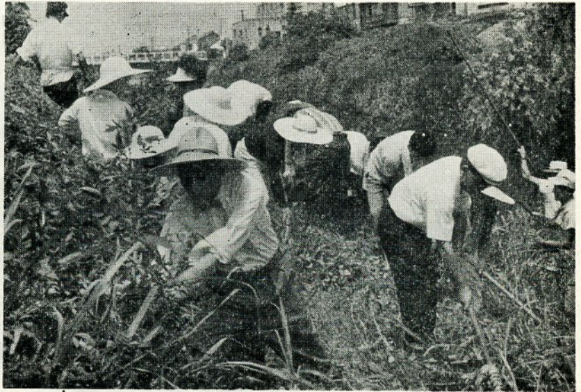
(一日清掃デーの市長)

昨年来、鳥取市美化推進委員会が生まれ、郷土を明るく、美しい街、清潔で、健康な街にしようとする市民運動がすすめられています。