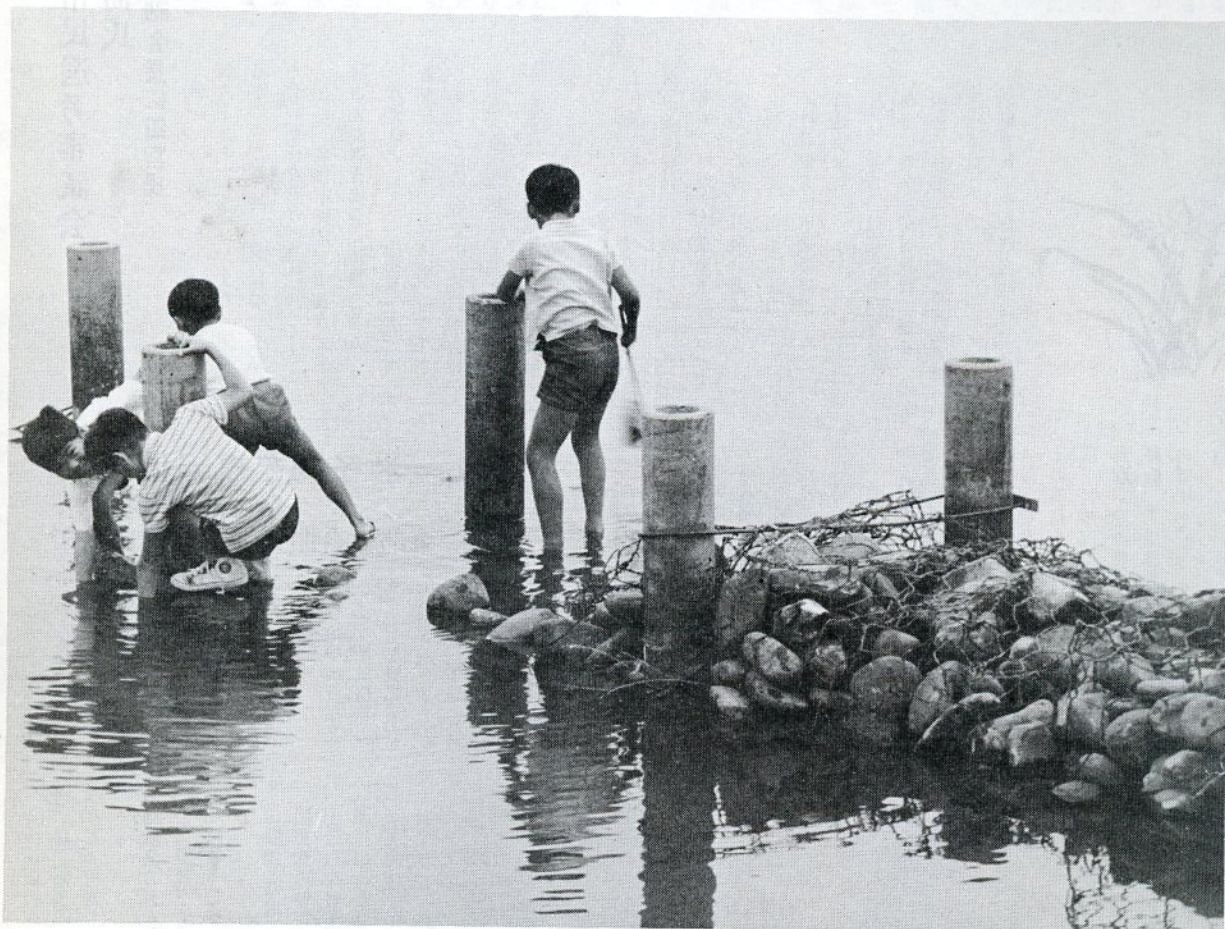
足をすべらせたら背がとどかない、こんなあぶないところに子どもたちは遠出している。

最近子どもたちの行動範囲が驚くほど広がっており、予想もしない遠くまで遠征しています。ヒヤッとするような交通量の多い国道を、混雑している町かどを、友だちと話しながら自転車をつらねて行く子どもたちを見かけますが、これからは、水の誘惑がはげしく、遠出する子どもたちもより多くなる季節です。そこには、水難が、交通事故がキバをむいて待ちかまえています。各家庭はもとより、よその家の子どもでも、危険なところでの遊びをみかけたら注意をしてやりたいものです。