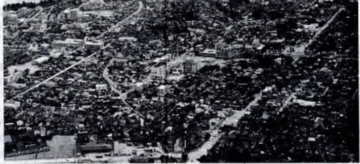
空から見た米子市の中心街