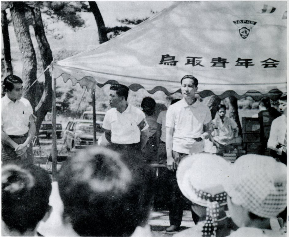
施設の子どもたちと楽しい運動会