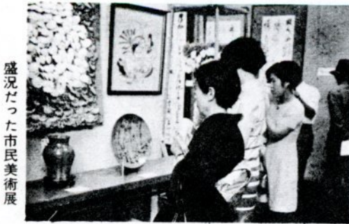
盛況だった市民美術展