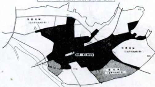
鳥取市工場騒音規制地域指定図

貸付け 所要額の五十パーセント (一企業あたり十万円) 三百万円、特例 六十万円まで)