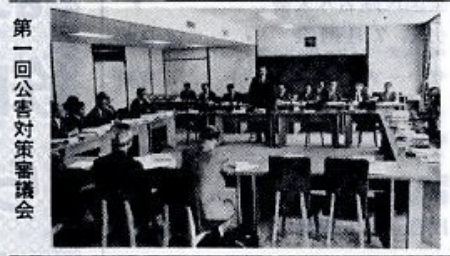
第一回公害対策審議会

また、県では市街地の騒音問題について調査を進めていきましたが、その結果、市街地の住宅地で、騒音がかなり問題となっていることがわかりました。騒音が六十五フオン以上