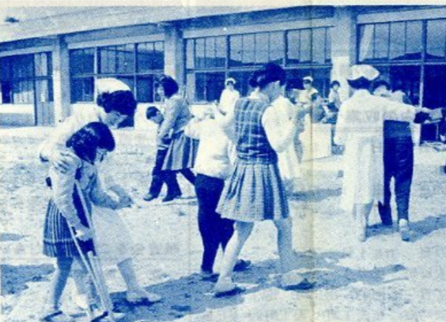
フォークダンスで機能訓練にはげむ子どもたち

精神的な不安や経済的な悩みを、少しでも軽くするため、社会的な責任を国に委ね、心身障害者に対する生活に役立つよう、国や県の大切な仕事に力を注いでいます。 このように、心身に障害のある恵まれた人たちの生活を保障し、自立できるように援助してゆくと、社会的な責任を国に委ね、心身障害者に対する生活に役立つよう、国や県の大切な仕事に力を注いでいます。