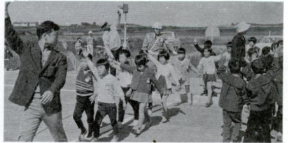
交通広場での横断練習 一 千代河原一

しました。歩道もあるこの練習広場での勉強はとってもよくわかったということでした。 なお、この広場で、毎年春、秋の二回、保育所や小・中学校の児童生徒に、正しい横断のしかたなど交通安全教育をすることになっていますが、町内会や団体などでも希望があれば、広場の使用とあわせて、シグナルや標示板などの貸し出しも行ないます。 お気軽にご利用ください。 市教委 体育課 電話 〇一八一 二内線 三三三