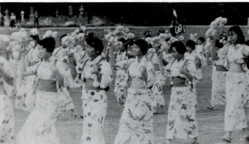
花がさを持ってリズムカルに踊る高草中女生徒たち — 総合グラウンド野球場で —

第十二回市民体育祭は、八月十日から始まり、十月十日総合グラウンド野球場での陸上競技をもって、十六種目にわたる熱戦の幕を閉じました。 この体育祭は、市民のスポーツ振興と健全な心身づくりに役立てようと、昭和三十三年から行なっているものです。 優勝 賀露校区 二位 日進 三位 美穂 四位 湖南 五位 世紀 六位 富桑 七位 修立・八位、城北 九位 稲葉山・十位、津ノ井