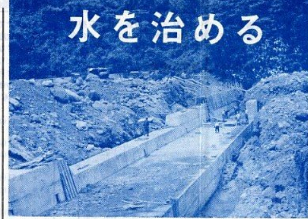
土砂を防いで洪水を予防 (佐陀川の砂防えん堤工事)

愛の献血に協力 みなさんの善意でよせられた血液で、きょうもたくさんの方の命が救われています。しかし、手術などで必要な血液は、まだまだ不足しています。七月は愛の献血月間。これを機会に、お互いに人命を尊重するうえで、愛の献血にみなさんのご協力をお願いします。