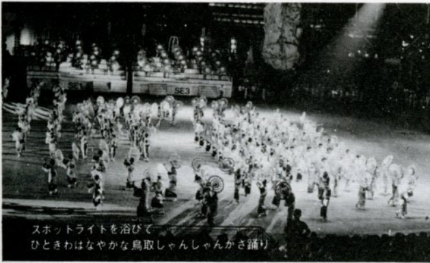
スポットライトを浴びて ひとときはなやかな鳥取しゃんしゃんかさ踊り

世界の国からコンニチワで始つた「人類の進歩と調和」をテーマの日本万国博は、九月十三日をもって一八三日間の幕をとりようとしています。三、〇〇〇万人の入場予想人員は、九月一日現在で五六八〇万人の入場者があり、終わるまでには六、〇〇〇万人を超えるのではといわれています。 この万博会場にあるお祭り広場は、世界各国から思想や言葉のちがった人々が集つて、ともに歌い踊り、躍動するエネルギーを爆発させる、いわば「人類交歓の場」ですが、この広場で、鳥取市のしゃんしゃんかさ踊りが七月五、六、七日の三日間開かれました。参加した二一八名の踊り子たちのリズムカルなかささばきは、スポットライトを浴びて、銀波となり金波にかがやき、観衆を魅了させしゃんしゃんと鳴る鈴の音は、ひとしおムードを盛り上げました。遠い海のむこうからやって来た外人たちは、ワンダフル、ビューティフルの連発でした。この人たちはくに帰って、日本の印象をフジヤマ、サクラ、とともにカサオドリを伝えてくれることでしょう。