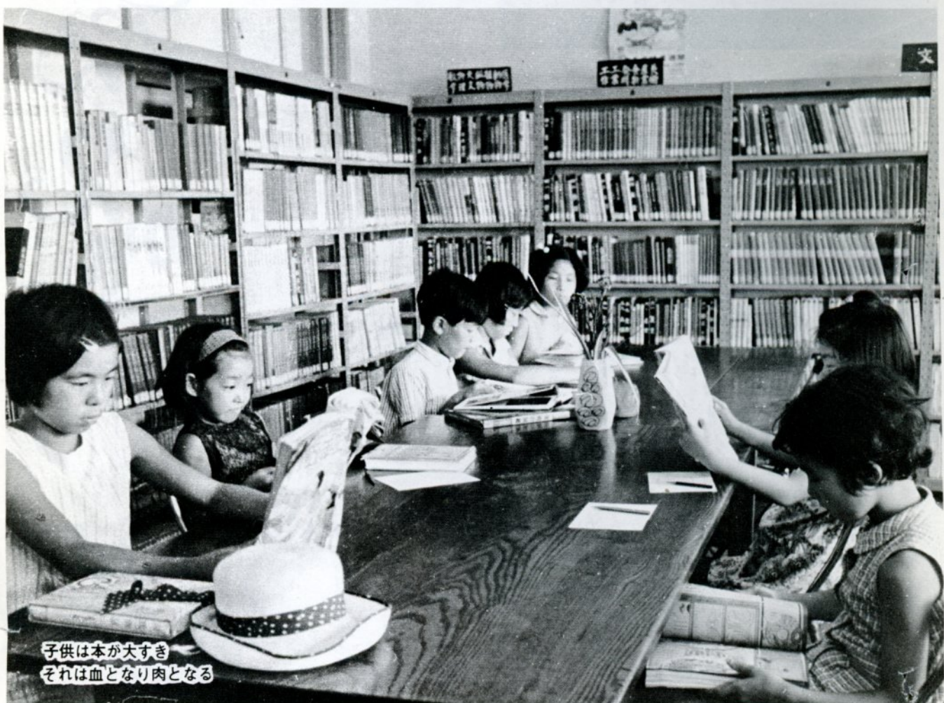
子供は本が大好き それは血となり肉となる