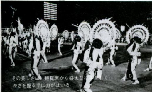
その美しさ、観覧席から盛大な拍手をかき渡る手に力がいはい

昭和四十年から始めたしゃんしゃん祭りは、年とともに盛大となり、ことしは四十三連の三、五五〇人が参加しました。沿道には緑台を持ち出している観客も多くなり、まちのあちこちからは、ヨイショイ……、ソレーなどと声援がかかり、拍手も多くなりました。