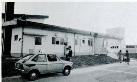
おとうさん、おかあさんと一緒に... 千代保育所

一日と成長が楽しみな園児たちの十九番目の市立保育所「千代保育所」が完成してから三カ月。子供たちも保育所の生活に慣れ、のびのびとした毎日を送っています。