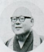
栄 無得 (44)

庭園をつくるというのは、なかなかむづかしいものだ。木や石を、どこに置いてよいと云うわけにはゆかない。素材そのものに、自ら座る場がある。したがって、地割