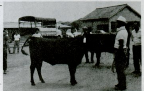
23回目を迎えた畜産共進会。さすが大物ばかり。