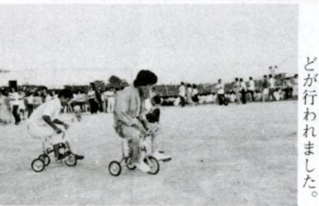
▲「ミス・カーニバル」選出(写真上)と三輪車早乗り競争。