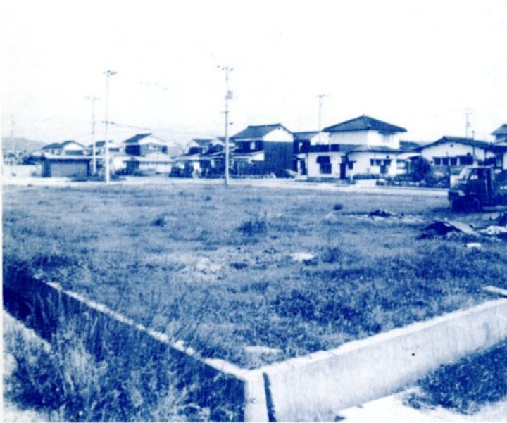
▲早期に開設が望まれる桜谷団地のショッピングセンター用地

②本市総合開発計画に基づく二十万都市をめざし、鳥取駅の高架化、駅前都市改造、あるいは津ノ井工場団地の造成、鳥取港背後地の造成等いろいろな施策に取り組んでいるが、これら造成地は既存業者の移転張りつけだけでは目的