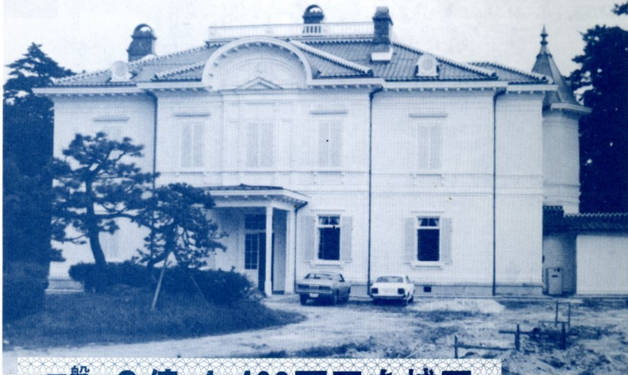
▶ ほぼ完成した仁風閣