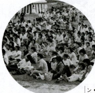
▲千代河原スポーツ広場に集まったヤングたち。笑顔がイッパイ。

また、今回が初めての「ミス・カーニバル」選出には、二十四人の「ミス・カーニバル」選出(写真上)と三輪車早乗り競争。 このほか、「かべぬりさん」傘踊り——の郷土芸能も披露。また、うどん、焼きイカ、金魚すくいなどの夜店、それにお茶席もなかなかの盛況。 ファイナレは、県中高齢者走ろう会のメンバー九人とミスカーニバルが点火したファイアストームを囲んでのフォークダンスと大合唱。九時近くまで若い歌声が続いていました。来年が楽しみです。