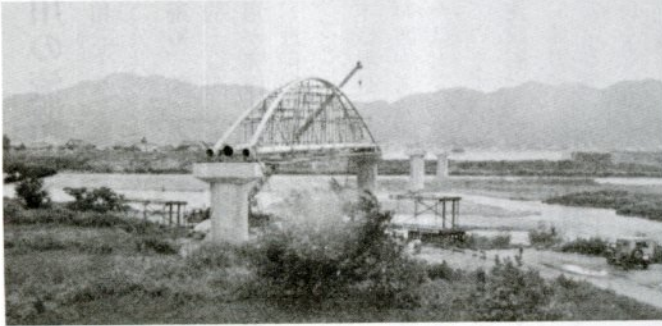
姿を見せた、千代川水管橋。7回拡張事業は着々と進行。

水道局では、昭和六十年の水需要(一日十三万五百立方足)に対して、後手にならないようにと、四十九年度から五十四年度までの六カ年計画で、第七回拡張事業(総事業費約四十億円)により水源の確保を進めています。 この事業では、源太橋上流の向国安に一日最大五万八千立方足の集水能力を持つ水源地の整備、上町・下味野・大路山などへの配水池の新設、送配水管の新設・改良などが行われます。 今年度は取水ポンプ設備、水管橋架設、導水管埋設(千三百四十足)、送水管敷設(二千四百八十足)、配水管敷設(六千七百六十足)などの施設整備(事業費約十億円)を進めており、これにより、来年夏からは「水」の心配は解消されることとなります。