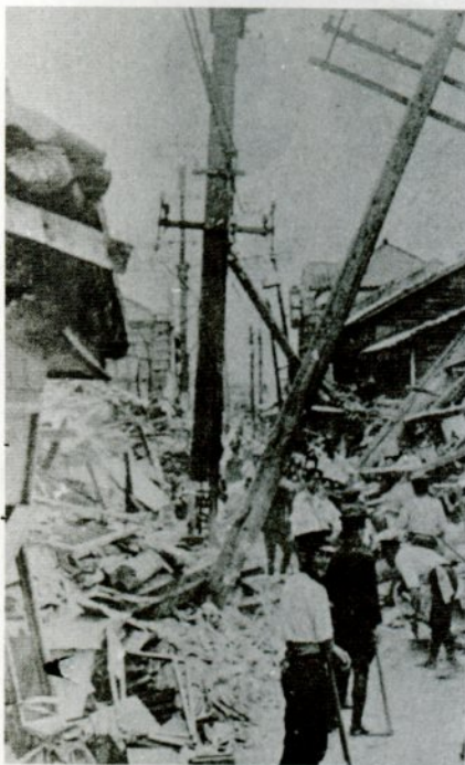
若桜街道筋の被害状況。復旧作業が進められています。

家がベチヤンコになつてたんじやないかと思ひます。外に出る時間があるかないかが問題だと思ひます。それで、二階から無理に飛び出そうと、一分以上もかかつて外まで出るといふことより、机の下に入るとか、何とかしてネ。二階はそうあわてる必要はないと思ひます。一階は外に出た方が安全だと思ひます。今では、自分の家から外に出るのに、どのコースが一番近いかに時間を計つています。玄関に出るのは十秒かかります。横の縁側と裏に出るのは五秒ですが、隣の屋根がトタン