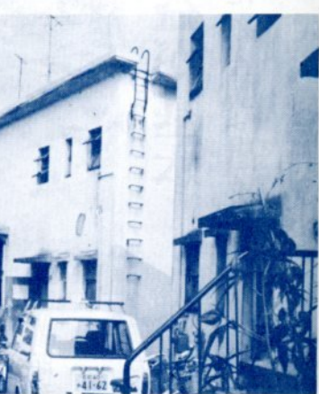
▲老朽化が進み改良されたことになった玄好町の市営住宅

京都の江戸川区、葛飾区では高齢 者事業団を設置し非常に好評を得 ているようである。事業の内容は 高齢者が自分の能力、特技を事業 団に登録し、事業団ではあらゆる 仕事を一括して受託し、それぞれ の能力に応じた高齢者に対し仕事 を割り当てる方法である。