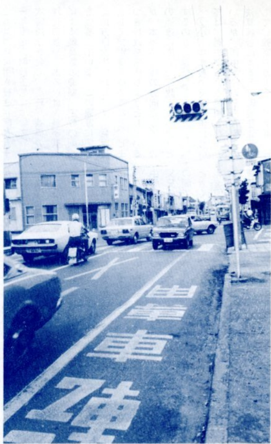
▲朝夕のラッシュ時には通勤などの車で混雑する吉方交差点