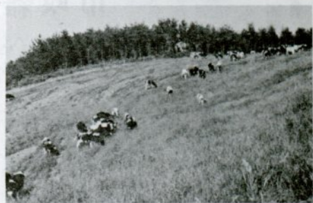
八十頭余りの乳牛が放牧されている空山県営牧場

今年、四月十六日、乳牛の放牧が始められた越路と郡家町門尾にまたがる空山県営牧場(本紙昨年十一月号で紹介)では、高原の風に吹かれて、ノンビリと草をはんでいる牛の姿が見られます。現在、放牧されているのは八十頭余りで、十一月下旬まで育てられます。