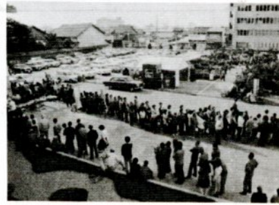
昨年の「木の日まつり」のよう。苗木プレゼントに大勢の市民が…。