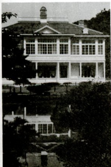
宝隆院庭園の池に、姿を映す白亜の洋館「仁風閣」