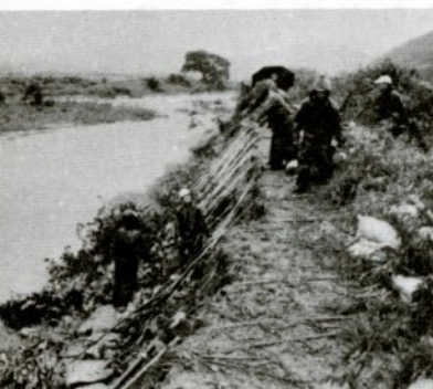
木流し工法で野坂川の水勢を弱め堤防の補強工事をする人たち (11日午後4時ごろ、野坂地内で)

校、保育所は午前中で授業を打ち切りました。夕方までには東吉成、滝山、大杖団地などの住民が小学校やお寺に避難する一方、災害救助法が適用されて、床上浸水世帯に医薬品、寝具、食糧などを支給。各地区では消防団、自警団、婦人会が避難、救助、護岸補強工事、たき出しなどに活躍し、事業所などから見舞品や食糧が提供されました。