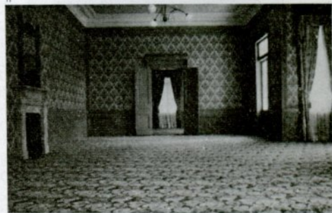
豪華なマンツルピースのある「謁見所」

が明記されています。以上、研究会の報告ですが、市ではこの報告を基に、実施計画をたて、五十三年度からの具体的着手を目指しています。