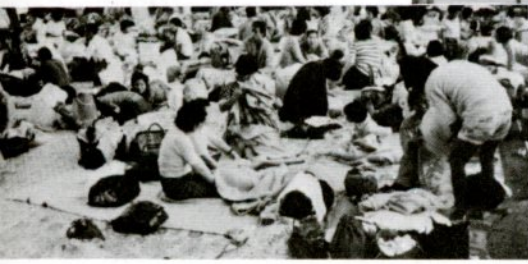
美保小学校に避難して不安な一夜を過ごした東吉成地区の人たち (11日午前10時ごろ)