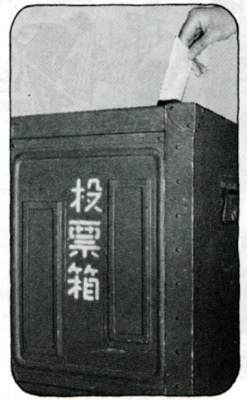
きれいな選挙、で一票を