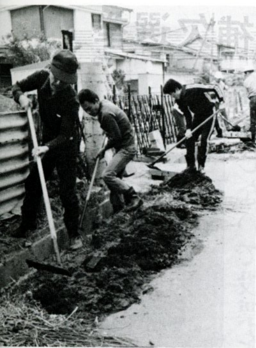
「ゴミのない美しい街をつくろう」と市民総ぐるみの一斉清掃。(昨年5月)

をした者を警察に検挙させたところ、その後、川にゴミを捨てた罰がこわいからしないというのではなさないですね。