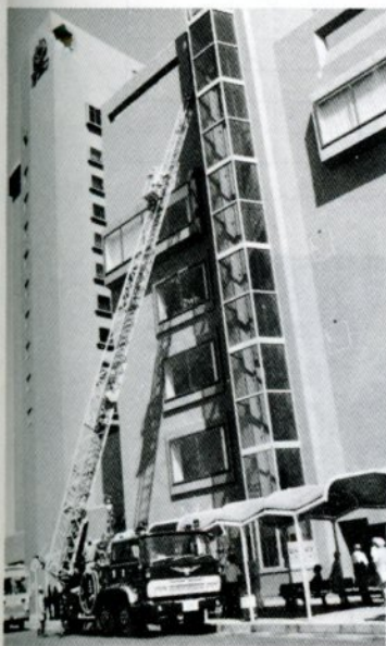
はしこ車を使い救助訓練(大丸で)

火を合図に訓練を開始、遷喬小、鳥取大丸、太平線、今町一丁目、各防災会避難場所を中心に避難、医療救護、給水、炊出し、初期消火、高層ビル火災消火救助など十種の訓練を正午まで二時間にわた