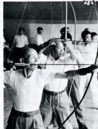
市民体育祭での弓道競技（9月3日、県営武道館で）

第21回市民体育祭は、いよいよ大詰め。十月十日（体育の日）に陸上競技と閉会式が布勢のサブグラウンドで午前九時から行われます。