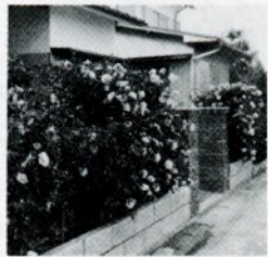
サザンカの生けがき

生けがきはブロックベールなどに比べると季節の移り変わりの楽しさや、生活にうるおいとやすらぎを与えてくれます。生けがきを自分の手でつくり、育てるのは経費も安く、また楽しいものです。