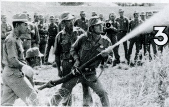
◀放水訓練 をする新採用 の東部広域 消防職員

鳥取市を中心とする県東部の広域市町村圏（市と岩美、気高、八頭三郡の十二町二村）の消防力を強化するため、県東部広域行政管理組合は五月一日から広域常備消防の事務を始めて