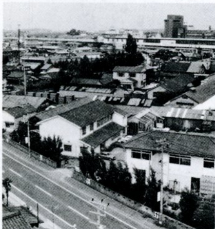
安全で快適な街づくりが進められる駅南地区

五十二年 度から調査 （委託）を 進めていた 鳥取駅南地 区総合都市 交通施設整 備の調査結果がまとまり、