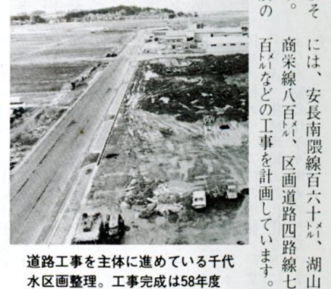
道路工事を主体に進めている千代水区画整理。工事完成は58年度

五メートル、同湖山商栄線（幅員十六メートル、延長一千六百六十四メートル）の幹線道路を新設するほか、国道九号線を現在の幅員九メートルから十五メートル（区域内は十二メートル）、同バイパスを同二十二メートルから三十メートルにそれぞれ拡幅。また区画街路、公園（広さ二万三千六百十六平方メートル）、水路、大井手川改修など公共施設の整備改善を行うとともに、個々の土地（工業用地）の形態も整えて総合的な街づくりを行います。工事完成は五十八年度の予定（全事業完成は六十二年度）で、総事業費はおよそ三十六億円が見込まれています。南バイパスは計画幅員三十メートルのうち二十メートル部分が本年度中に完成、供用開始される予定で、安長南限線は一部（幅員十三メートル）完了して使用できるようになっています。また本年度末には、湖山商栄線の一部（幅員七十六メートル、延長二千四百九十九メートル）と区画道路七路線一千五百四十四メートルが完成。来年度