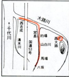
去年10月の台風20号により浸水した西吉成地区。大路川の拡幅などで浸水解消が期待されている