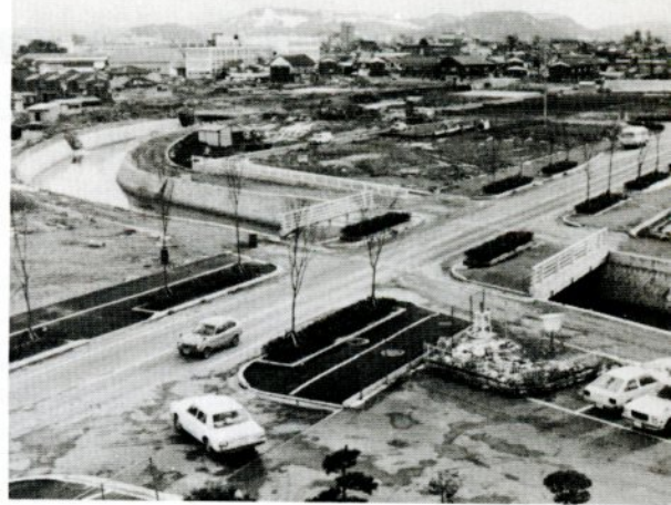
来年度の工事完成を目指す田島区画整理。地域内では下水道整備と狐川改修工事も進行中

造工事や道路舗装はほぼ終わり、後は公園整備、街路樹植栽などを残すのみとなっています。