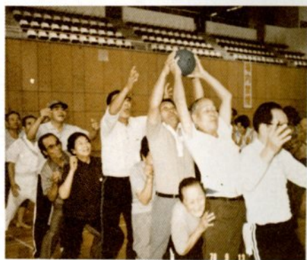
(老人スポーツ大会)