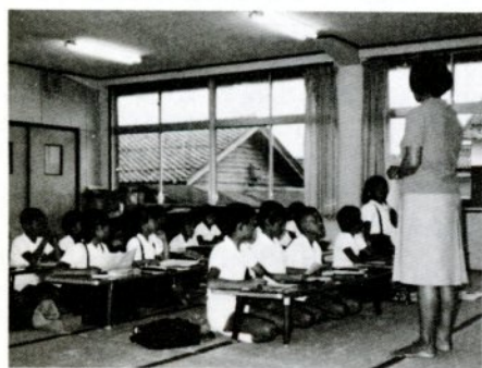
古海隣保館での学習会（大正小5年生）

代に育った私たち親の不安をよそに、日一日とたくまじさを増して来たわが子の姿を見るにつけ、ややもするとくじけそうになるわが身を反省させられます。幸いに、今の子供たちは学校教育の中で正しい同和問題の学習を積み重ねて来ており、部落差別に対する怒りを訴えることが出来るまでに育って来ています。 私たち母親も、子供とともに学ぶ気持ちをついにしつと、今後とも、あらゆる研修会に参加して、わが子に正しくはつきり教えることの出来るよう努めたいと思います。（大正小PTA、38歳） なくす努力をしなくては行けないんだ。母の言っていることは、わかることもあったが、全部はわからなかった。でも「一生けん命勉強してな！」という母のことばにはうなずいた。 おとなの人たちは、長い間かけて努力して、隣保館や児童館を建ててくれた。その建物を使って毎週火曜日に一時間、学習会をしているのがぼくたちだ。お母さんたちも、夜になってから学習している。何の学習かわからないけれど、お母さんたちも一生けん命だ。ぼくも一生けん命勉強して、差別はいけないことだ、とはつきり言えるようになってほしい。