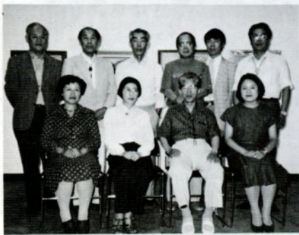
ことし6月に22回目の展示会を開催

ジャズ体操を通じて日常の健康づくりに役だてようとのねらいで行われたもので、百三十人の会員が