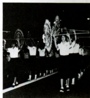
制服姿で踊る初参加の中学校連

午後六時からはメインの一斉踊りが始まりました。初参加の市中学校連、砂丘ツトリングクラブ、市観光協会、トミタ電機、中国電力、河原町、国立鳥取療養所、三洋製紙の八連をはじめ、第一回からの連続参加の智頭街道商店街連ら四連など四十二連三千七百人の踊り子たちは、本通りく若桜街道く片原通りく智頭街道く昭和南通りのコースで、九時まできんせりなどの音を響かせました。