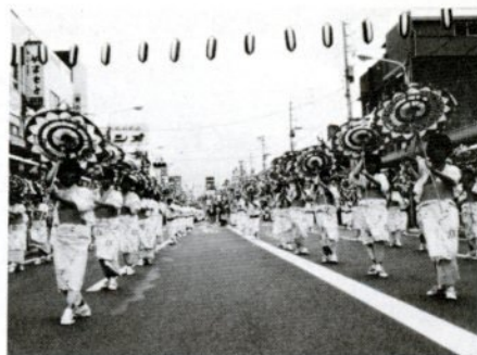
42連3,700人の踊り子が舞う一斉踊り

中学生からは、「しゃんしゃん祭をみんなが参加できる活気のある祭りに」「駅前の風紀が悪いので取り締まりを」「多くの催し物ができるように広場や公園を作って欲しい」「鳥取市だけを考えないで県東部地域の中心都市として広い考え方で町のづくりを」などの意見が出され、小学生からは「ジェット機の飛ぶ空港を早く作って」「大雨が降ると校庭が水浸しになるので早く川を直して」「児童数が多くて教室や実験道具が足りないので早くなんとかして欲しい」など、活発な注文が出されました。市長と教育長は、学校の施設整備は計画的に進めていき、鳥取市が将来、明るく住みよい町になるようにがんばることを約束していました。