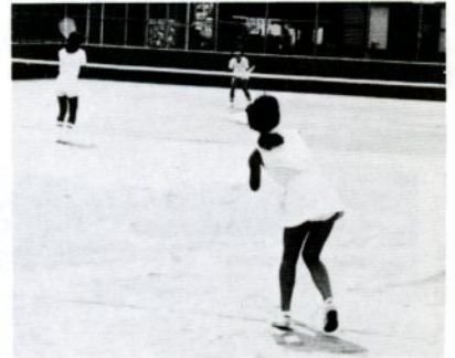
軟式庭球—千代テニス場で