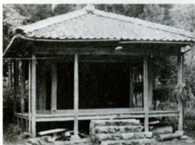
地蔵菩薩が安置されているという横原字小原の地藏堂

成したが、彩色の終わらぬ間に法師は急病にかかり亡くなった。法師の妻子は嘆き悲しんで棺のそばを離れなかった。六日めに突然棺が動いて法師が蘇った。法師の話