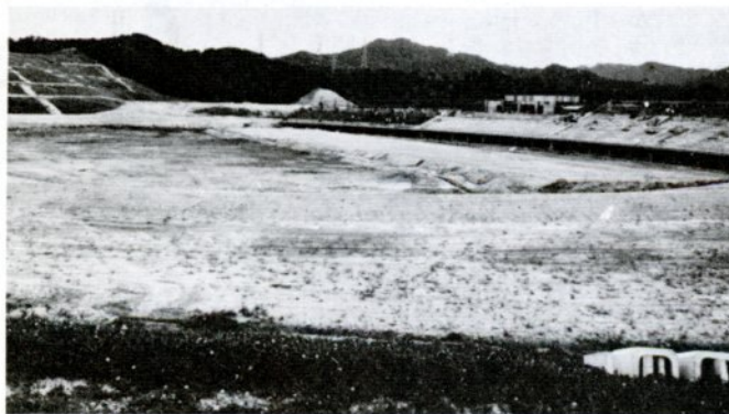
工事の進む県営布勢総合運動公園

が当たり、本市は宿泊や輸送、受け付け、接待、駐車場確保などを担当、順調に大会日程を消化しました。