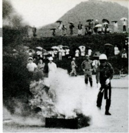
油火災の初期消火訓練をする明徳地区の皆さん (市民スポーツ広場で)