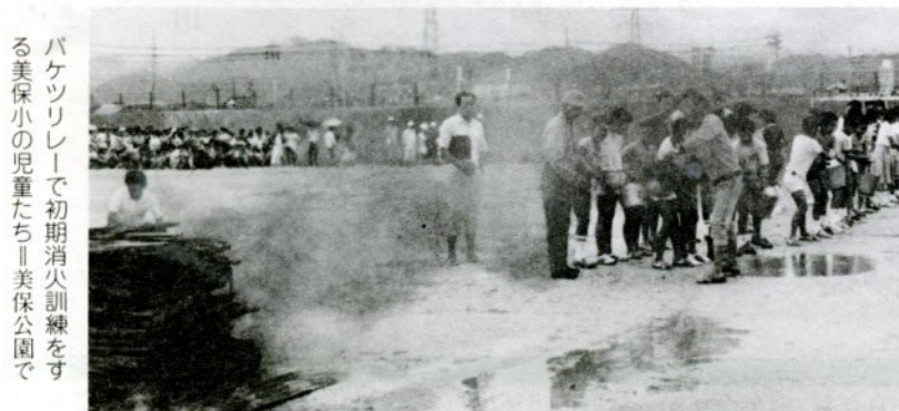
バケツリレーで初期消火訓練をする美保小の児童たち(美保公園で)