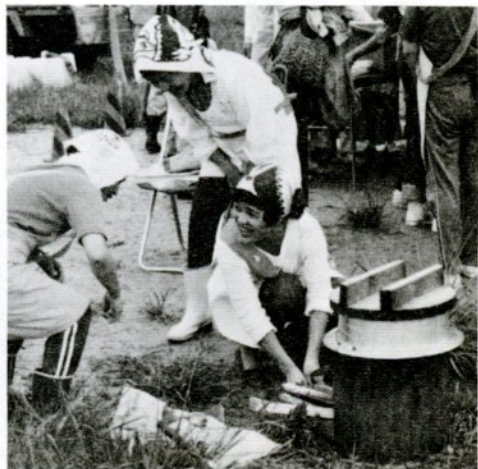
炊き出し訓練では、かまとまきを使った主食の炊飯も実施 (市民スポーツ広場で)