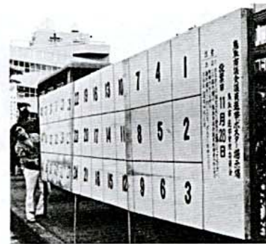
市役所前の市議選ポスター掲示場