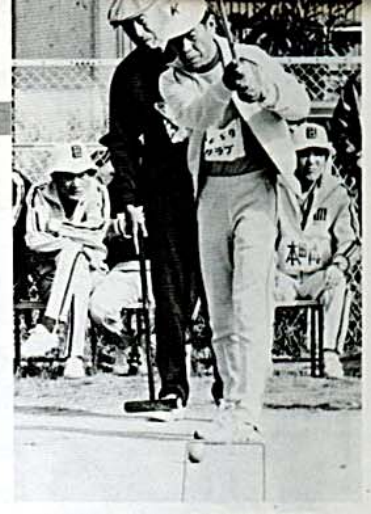
ゲートボール大会で熱戦を展開

これらの大会は、市民みんなが「いつでも、どこでも、気軽に」スポーツを楽しもう、という市民総スポーツ運動が提唱された五十一年から毎年開かれてきているもので、今年で六回めです。バレーボール（市民体育館）に男子の部十一チーム、女子の部十チーム、卓球（勤労青少年ホーム体育館）に十四チーム、ゲートボール（吉方南公園ゲートボール場）に三十六チームがそれぞれ参加し、熱戦を繰り広げました。