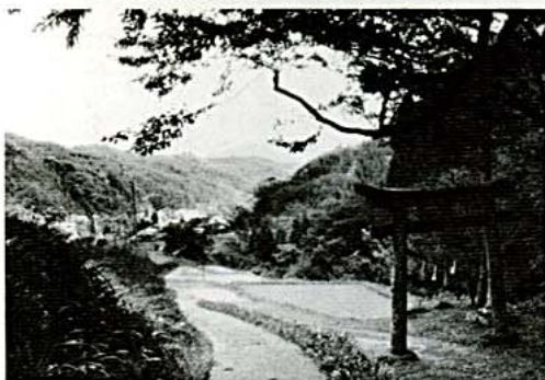
岩坪神社鳥居付近から望む岩坪地区