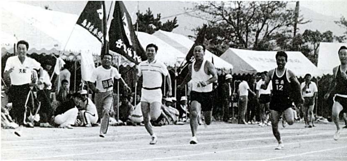
力走 40歳台男子百斤競走