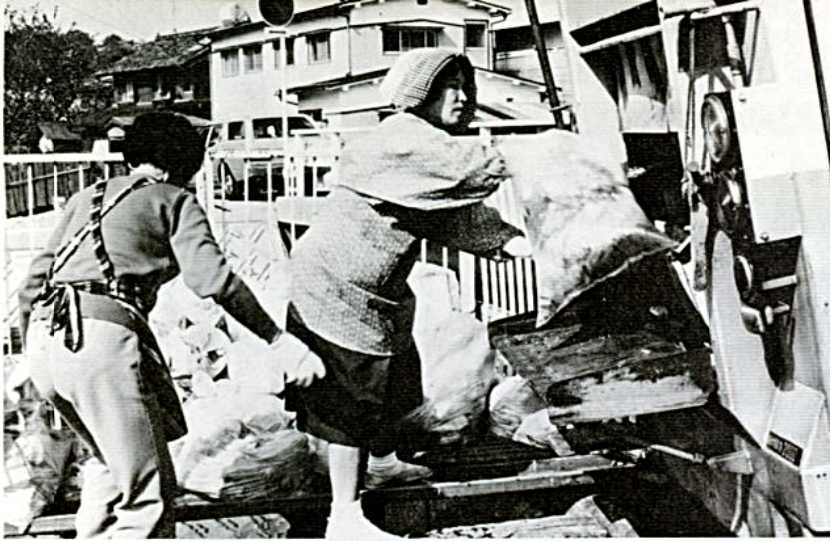
可燃ゴミの収集作業を体験する婦人のみなさん(湖山・島川地区のステーションで)