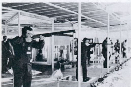
初撃ちする県クレイ射撃協会のみなさん

六十年わかとり国体のクレイ射撃の会場として、覚寺地内に建設を進めていた鳥取クレイ射撃場が完成、一月二十六日に完成式が行われました。 同射撃場は平地面積約一万五千平方メートル、トランプ射場(八千九百平方メートル)とスキート射場(二千八百平方メートル)各一面のほか管理棟、駐車場の設備があります。