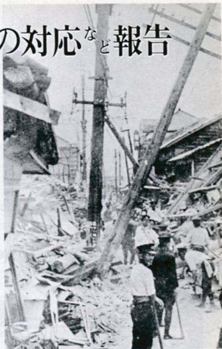
昭和18年9月10日の鳥取大地震の被害状況 (若桜街道筋、若桜橋東側より)