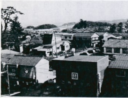
商業高の屋上から見た湖山町