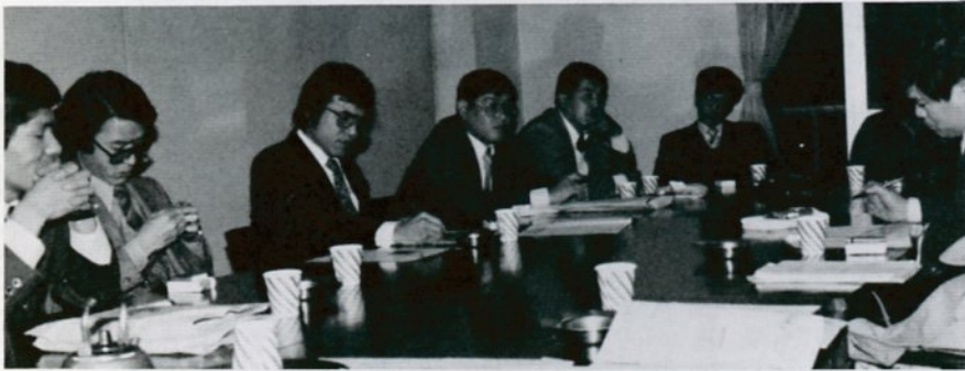
「鳥取に若者が定着するには」をテーマに話し合う鳥取青年会議所のメンバー

会員 いわゆる高学歴の人に適した企業というのは、少ないのではないかと。司会 今、手もとに正確な資料がないが、やはり鳥取には、大学卒業者を受け入れられる企業が少ないのではないかと。