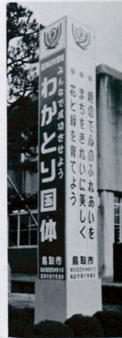
わかとり国体の広告塔 (市役所前)

にはどうしたらいいか、各方面の人たちの意見をお聞きし、すぐできるものから進めていくつもりです。地もとの人が気がつかない良いものがたくさんあるので、それらの掘り起こしも大事ですね。国