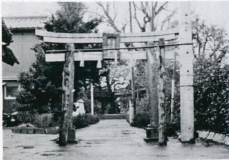
古市地区の氏神である古市神社

名抄」にも載せられている古い地名である。古市の地名でまず連想されるのは、古くから市場の発達した土地、古市場である。そのことからであろうか、かつてこの地に古市千軒という大きい市場があったという伝承がある、と『因幡志』に記されている。しかし、十世紀、ないしはそれ以前にこの地に古い市場があったとすることは大いに疑問がある。