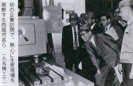
初の企業訪問で、熱心に生産現場を視察する西尾市長ら(大鳥機工で)

推進員は、各地区で市が実施する健康教育や健康相談、健康診査などの保健事業に参加するよう、地区住民に呼びかけたり、参加者をとりまとめる仕事を受け持つこととなります。任期は三年です。