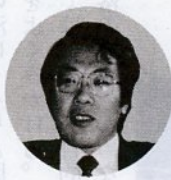
大塩さん たしは油絵をかくグループで、月に一回写生会、春と秋

すし、そういったサークルのリーダーシップをとっているのが鳥取音楽家クラブで、四十数人で結成されています。