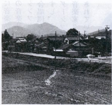
千代川堤防から望む菖蒲地区

か小川のような流れを意味することである。なるほど菖蒲の南には有富川が流れて千代川に合流