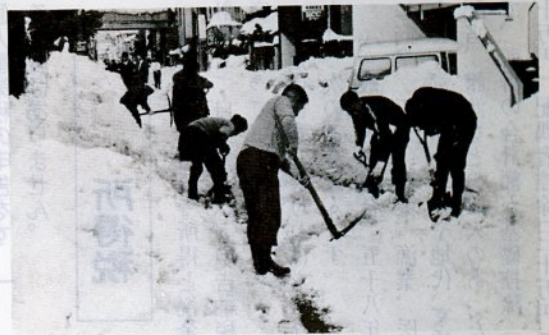
町内ぐるみで雪かき作業をする市民＝若桜町で＝