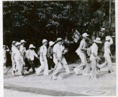
去年8月の195回例会。目的地は摩尼山

五月に始まった鳥取市みんなで歩こう会が一月八日の例会でちょうど二百回目になりました。この間、歩いた距離は約二千キロ、鳥取から北海道・旭川まで歩いたことになりました。また、五十年十