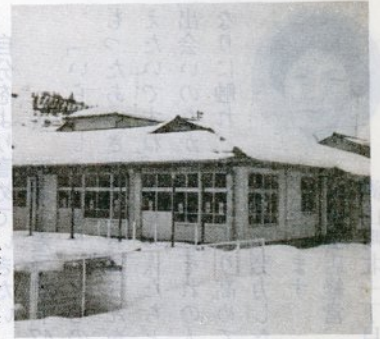
4月開園予定の白ゆり保育所

《津ノ井小学校》現在の校舎が老朽化したため五十八、五十九両年度の二か年計画で現校舎裏に移転新築、六十年一月に完成の予定です。総敷地面積は約一万七千六百平方メートル、校舎は鉄筋コンクリート造り三階建てで、延べ面積は約三千四百平方メートル。五十九年度に建設する屋内体育館は鉄骨平屋建てで、延べ面積は約九百八十平方メートル。普通教室は十三教室、特別教室は七教室の予定。全体の総事業費は約十億円で、簡易保険積立金還元融資施設です。