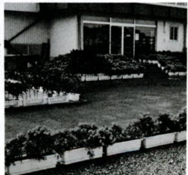
面影地区公民館の花壇

ここを基点として「あいさつ運動」を起こし、久松地区に触れ合いの輪を広げ、とかく控えめで照れがちな心を奮い立たせ、より明るい町づくりをしよう、と皆で話し合っています。そして、これをもとにしてあいさつ運動の輪が広がり、来たる「わかとり国体」で全国からおいでになるかたがたにも、触れ合いの心で接することを願っています。久松地区市民運動推進協議会会長