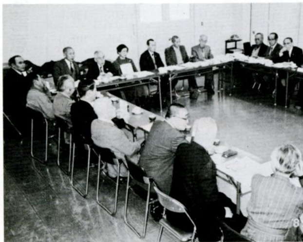
月1回地区総務が集まって、福祉活動の推進について話し合う

促進され、福祉の輪が広がります。豪雪の時も、近隣の人々の協力で素早く除雪され、花好きのおばあさんの家には、丹精込めて育てられた四季折々の花が届けられるなど、優しい心に触れ、大きな感銘を覚えまし