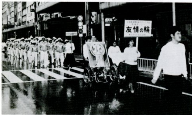
十日の午後鳥取市で行われました。この意義ある大会を県民総参加