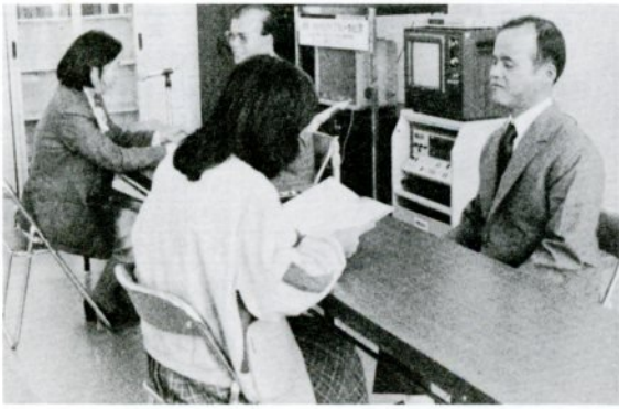
去年十一月三日の対面朗読サービス (市民図書館視聴覚ライブラリーで)

目の不自由な人が自由に読書できるように、と去年十一月から「対面朗読サービス」を実施いたしました。このサービスは障害者の強い要望の声が高く、読書週間にちなんで十一月三日から毎月第二、第四日曜日の午前十時から正午まで、市民図書館視聴覚ライブラリー室で行っています。朗読はボランティアの皆さんの理解と協力に