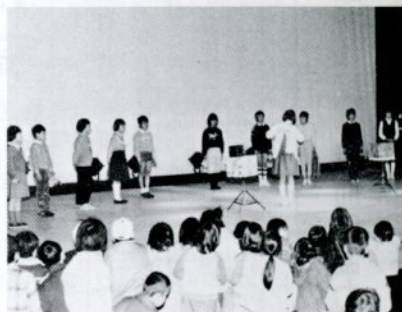
去年3月4日の文化センター展示発表会

【作品展示】 3月1日(金)〜3日(日)、午前9時30分〜午後6時。文化センター展示ホールで。