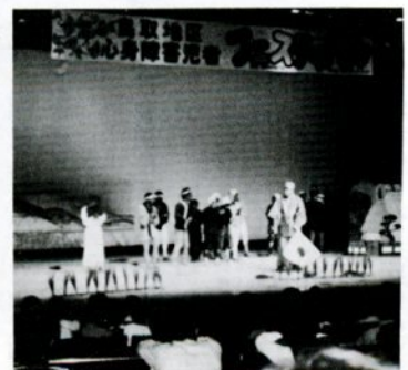
去年の心身障害児者フェスティバル

心身障害者の皆さんは、心身のハンデを克服しながら自立更生を目指し、懸命に努力をされています。施設、学校間の交流がないので、今年度から日常の訓練成果やクラブ活動、あるいは余暇活動を通じて体験した技能、演技を発表して社会参加への道を開くこととあわせて、心身障害者問題について広く一般市民の理解と認識を深めるため、十月十五日、文化ホールで「鳥取地区心身障害児者フェスティバル」を開きました。