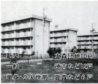
大森団地10戸 徳吉など12戸 賀露など6戸 新築一般 単身・2人世帯

59年度に新築した市営住宅。大森団地(中層耐火構造4階建て、3DK)第2種10戸程度の入居者と、市内各地の市営住宅補充入居者を募集します。入居できるのは、市内に