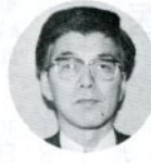
少年を非行に走らせる親の態度や親子の関係とは、どのようなものでしょうか。

第二は、少年のしつけや行動に関して父親が無関心であったり無気力であることです。少年が何をしても知らないふりをして、一方では母親が必ず以上に口やかましい人になつていることがあります。