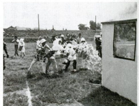
防災会の婦人らの三角バケツを使つての消火訓練(市民スポーツ広場で)

昭和十八年の鳥取 大震災から四十二年 目の九月十日、午前 十時から正午までの 二時間、市総合防災 訓練を実施しました。 会場となった市民ス ポーツ広場や富桑小、 各防災会などで、訓 練に参加した約二万 五千人の市民は、避 難誘導、初期消火、 救急などの訓練にて きぱきと取り組んで いました。