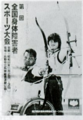
わかとり大会のポスター

みです。毎日の練習はつらいが、この体験を卒業後の福祉活動に役立てたいと思っています。