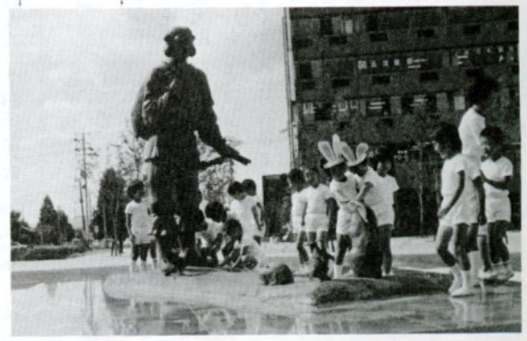
完成した駅南広場のモニュメント「大黒さまと白ウサギ」

この日の除幕式には約百二十人が出席。モニュメント制作者の入江さんや西尾市長、柄川鳥取駅長、事務所家庭相談員と私とでA君を見に行くことになりました。私たちが訪問したとき、A君はうろろう歩き回り、他人のかばんに興味をもち、中身を取り出して楽しんでいました。こちらの尋ねることに無関心で、自分の気の