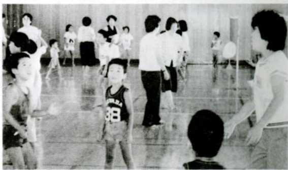
「ふれあい教室」でゲームを楽しむ親子ら(大樹荘で)

母子家庭の母と子が一堂に集まり「母子ふれあい教室」を去年七月二十七、二十八日の二日間、大樹荘で開きました。この「ふれあい教室」は、鳥取市、市社会福祉協議会、市連合母子会が一昨年から催している事業で、母子実内と家庭間の触れ合いを深めながら、母と子に生きる希望と自信を得、母子家庭の福祉増進を図るのがねらいです。