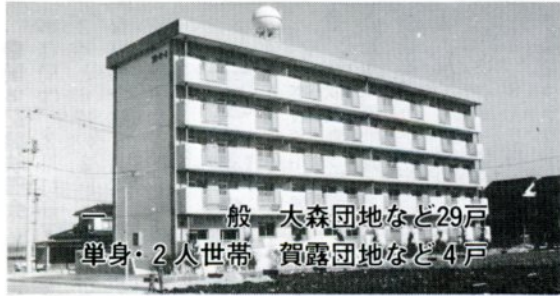
大森団地など29戸 賀露団地など4戸 一般世帯 2人 单身

が徳吉、賀露、湖山で11戸 ③第2種住宅(单身又は2人世帯向け)が賀露、湖山で4戸。