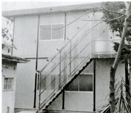
完成した福祉作業所

鳥取市精神薄弱者育成会は、五十七年に「かめの会」を結成し借家で作業を始めましたが、市民の念願で立派な会の作業所が去年