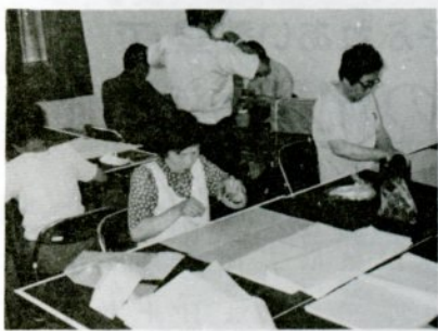
つくしの会による鳥取通所授産所での作業奉仕

日常、何気なく行っている仕事を、社会的な生活の場で活用していけば、それはボランティア活動