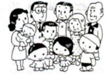
6月は「まちづくり月間」です