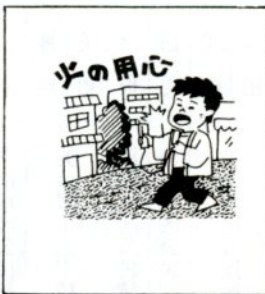
離れるときは火を消して

天ぶら油による火災は、建物内で発生した原因のトップになっていきます。そしてさらに増え続けています。