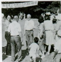
1 昨年のふれあい広場