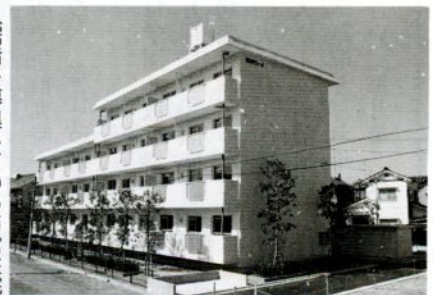
入居者を募集している市営住宅 大森団地

市営住宅入居者を募集します。入居を希望する人は、建築課住宅係に備え付けの申込書(11月17日から交付)に必要事項を記入して、20日(木)27日(木)に申し込んで下さい。抽選は12月9日(火)に市民会館で行います。 収入基準など詳しいことは建築課 ☎市役所内線387へ。募集団地は次のとおり。