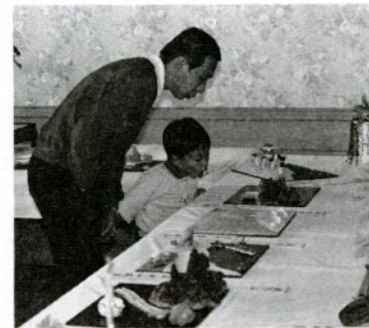
工芸菓子に見入る親子連れ

盛り上がったところで、アトラクションの「牛の鳴きまねコンテスト」が行われ、県外客を含む五十五組の出場者が個性的な鳴き声を披露。審査の結果、入賞者二十組に因伯牛の肉五百グラムと地酒五合がプレゼントされました。