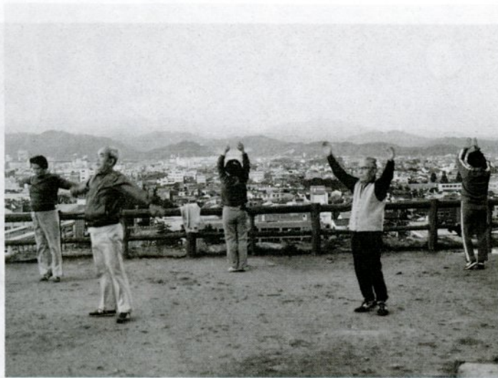
二の丸三層やぐら跡でラジオ体操をする二の丸会のみなさん

鳥取市のシンボルとして市民に親しまれている久松山が、全山開放されて五十年たちました。久松公園、樗谿公園とともに順次整備され、多くの市民が健康づくりに利用しています。さらに親しんでもらうため、日ごろ活用している皆さんに久松山の現況や要望を話し合ってもらいました。(二一―四六)