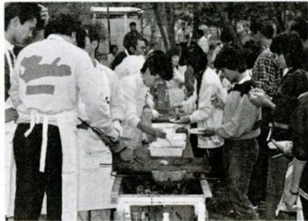
丸焼きコーナーで因伯牛の焼き上がりを待つ人たち（10月15日）

牛刺し、ステーキ、アミ焼き、丸焼きの四つのコーナーが設けられ、入場記念の一合マスで地酒を酌み交わすグループ、岳ビールを片手にステーキの焼き上がりのを待つ人たち（10月15日）