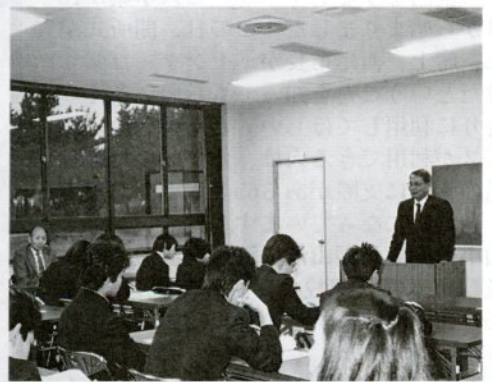
昨年度の城北高同和奨学生宿泊研修(サイクリングターミナルで)