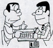
申告相談が始まります

は、2月16日(月)~3月16日(月)です。申告受付の混雑を避けるため、次の19地区では