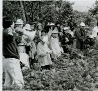
去年の野外教室で布勢古墳の説明を聞く参加者たち

子ども科学館は秋の親子野外教室を次の日程で行います。雁金山と丸山城跡で郷土の歴史を学習します。