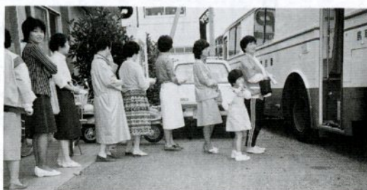
子宮ガン検診を受ける婦人たち

日曜日や祝日の急病人のため、NHK鳥取放送局横の因幡医師会館(戒町)に休日急患診療所(☎2212782)が設けられています。診療時間は午前9時～午後5時です。