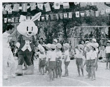
ロビットダンスを演じる白ゆり保育所の園児たち

市内にある保育所が63年度入所希望の園児を受け付けます。受付期間は12月1日（火）～25日（金）。入所を希望する保育所で入所申請書を受け取り申し込んで下さい。 保育所は児童の保護者が働いているか、病気などで保育できない場合に預り、保育教育を行う所です。問い合わせは厚生課児童福祉係（市役所内線294）へ。 園児を受け付ける保育所は次のとおりです。※印の保育所は、土曜日午後6時まで保育します。なお、あすなろ保育園は3歳未満児のみ保育。 〔自治振興課担当〕 相談日 12月15日（火）63年1月14日（木）午後1時～4時 申し込み先は自治振興課広聴係（市役所内線209）へ。定員10人。 〔市社会福祉協議会担当〕 相談日 12月21日（月）63年1月18日（月）午前10時～午後3時。 申し込み先は市社会福祉協議会（福祉文化会館1階）へ。定員8人。