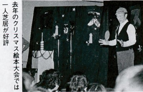
去年のクリスマス絵本大会では一人芝居が好評

27日 風街チャリティコンサート(有) 【文化センター映写室】 6日 科学映画会「むしさがし」 [午 後3時]