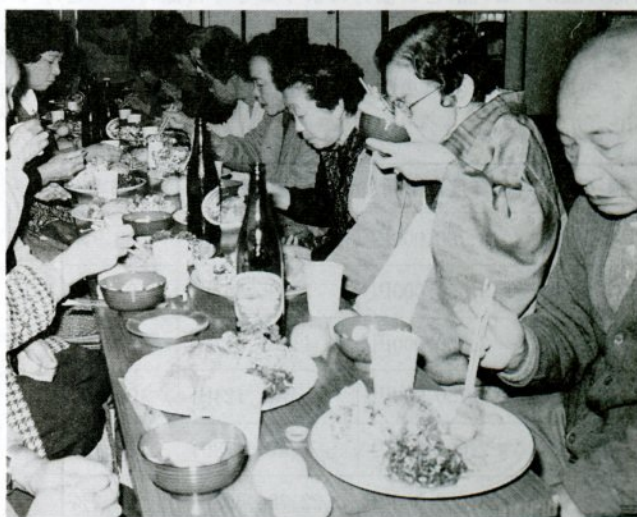
修立地区でのひとりぐらし老人との会食