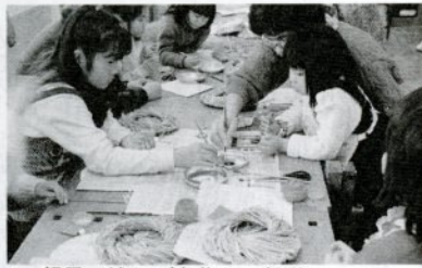
親子で流しびな作りに挑戦 (去年の発表会で)

市社会福祉協議会は「ボランティアスクール」を次の日程で開催します。どなたでも参加できます。 日時 3月12日(土)午後1時30分~4時30分 3月13日(日)午前10時~午後3時30分 会場 福祉文化会館 12日の内容 ①ボランティアのすすめ ②映画「街の