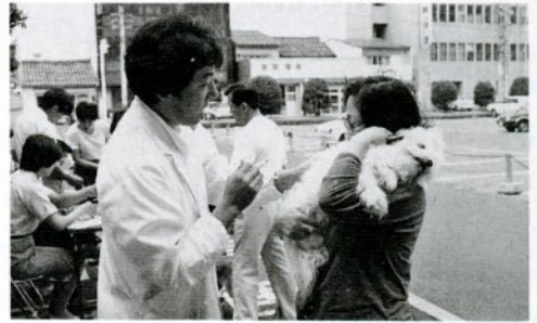
獣医師から予防注射をしてもらうペット犬

なお、飼い犬の死亡などで飼育していない場合は、厚生課（☎市役所内線303）へ届け出て下さい。 飼えなくなった犬は、毎月第3水曜日に地区公民館で引き取りますので、事前に保健所から厚生課に連絡して下さい。