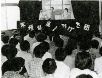
「末恒健康ひろば」で人形劇を演じる

仕事を待つ人には空き時間を、幼児の居る人には託児室を、出掛けにくい人には最寄りの公民館への出張など、受診しやすい条件を整えながらお年寄りが大切にされる社会を目標に、推進員一同張り切っています。