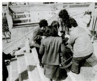
車イスの上げ下げは静かに

車イス介助教室 車イス使用者は、段差や階段、急な坂道、長い上り坂では大変困ってしまいます。車イスの人が街で困っていたら、まず声をかけましょう。