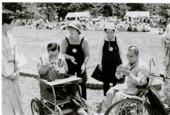
「障害者と市民のふれあい広場」の抹茶コーナー

福祉、在宅福祉の推進強化に努めます。 昭和六十一年度から二年間、国の指定を受け、福祉ボランティアのまちづくり事業の推進を展開してきた各般にわたる社会福祉活動を、六十三年度も継続して実施いたします。 「だれもが安心して暮らせる福祉のまち」を目指して、さらにきめこまやかな社会福祉活動を推進し、本市の社会福祉事業の向上に努めます。 各事業の予算は別表のとおりです。