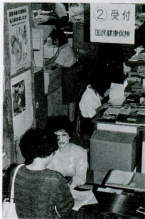
「国保」の受け付けは②番窓口です