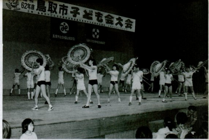
鳥取市子ども大会でしゃんしゃん傘おどりをおどる子供たち