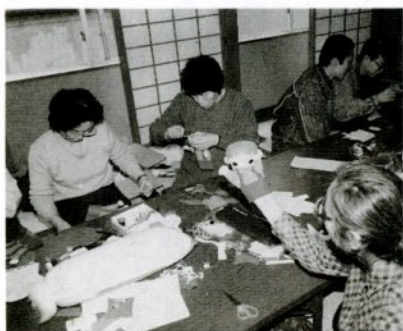
手づくりおもちゃをつくるボランティア

手づくりおもちゃは▽知育を促す（数、型、大小、文字、数字などで遊びながら覚える）▽情緒性を促す（美しい音、かわいい人形などで情緒性を育てること）▽社会性を促す（ままごと、自動車ゴッコなどゴッコ遊びで社会のルールを学ぶ）—などに大変効果を上げます。