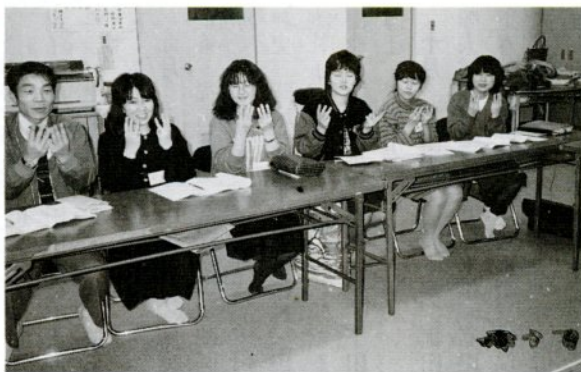
手話は手まね、身ぶりの会話法。口を大きく開けて話して下さい