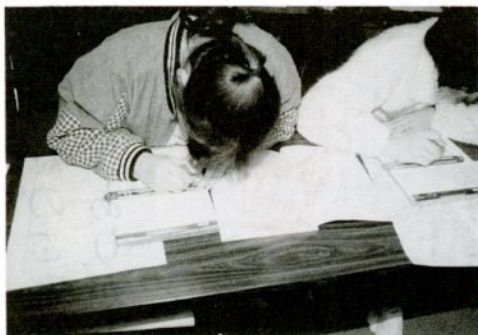
点訳は時間がかかる仕事です

点訳教室 晴眼者が日常何気なく読んでいる活字は、視覚障害者には読めません。そこで、視覚障害者の文字である「点字」に打ち直すことが必要となります。「点字教室」は、この点字の基