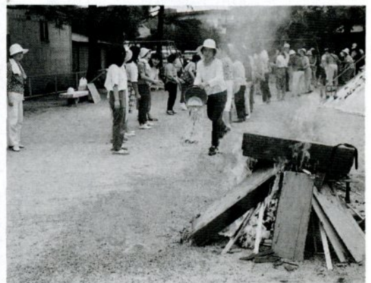
消火訓練のパケツリレールをする 寿町二区町内会の人たち