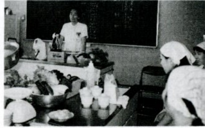
糖尿食の料理講習を受ける主婦たち

市立病院は、次の日程で糖尿食の料理講習会を開きます。費用は1人500円。申し込みは、午後1時〜4時に同病院内科外来(☎2316211)へ。先着20人で締め切ります。