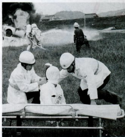
乗用車の衝突で負傷した運転手を救助する消防隊員

地震は今のところ、いつ、どこで、どのくらいの規模で起こるかといった予測が困難です。従って、身を守る方法は、日ごろの心構えにあるといえます。万一、大地震に見舞われても、正しい防災知識と的確な行動力を身につけていれば、被害を最小限に食い止めることができます。いつ襲ってくるか分からない大地震に対し、冷静な行動ができるよう、次のようなことに心掛けておきましょう。