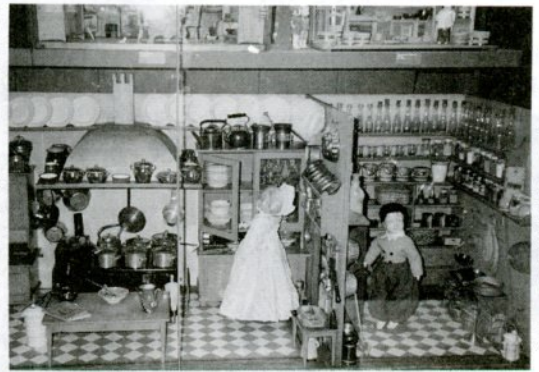
来年のおもちゃ博に出展されるハーナウ市の人形美術館の人形

館長は、おもちゃを「文化財」と考えており、ドイツを中心としたヨーロッパのおもちゃ文化を日本を紹介できると、今回の貸し出しを喜んでいました」とハーナウ市の印象を報告。