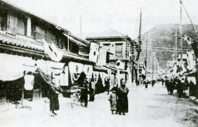
智頭街道の繁盛ぶり（中央の建物が鳥取郵便局）

鹿野街道は、江戸時代から明治、大正にかけて、鳥取第一の繁華街であった。明治の終わり