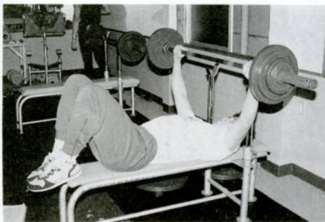
バーベルを使って筋力トレーニング

前回、ボディビルは筋力、筋肉作りという面と成人病予防、減量、シエイブアップ、リハビリテーションなどの特性を持ったトレーニングであると紹介しました。これらを総称してウエイト・トレーニングと呼び「ボディビル」という言葉は、現代では競技にのみ使われます。ウエイト・