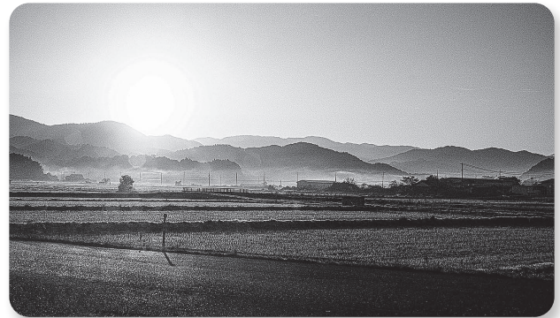
12月の作品「朝露の町」