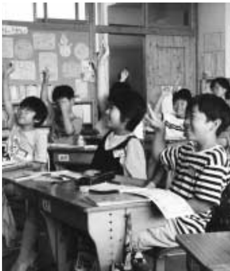
21世紀を担う子どもたち

この数値は、国、県の長期的な社会経済の見通しを踏まえ、鳥取市の過去の傾向と将来の発展可能性を基礎にして設定した「目標値」です。