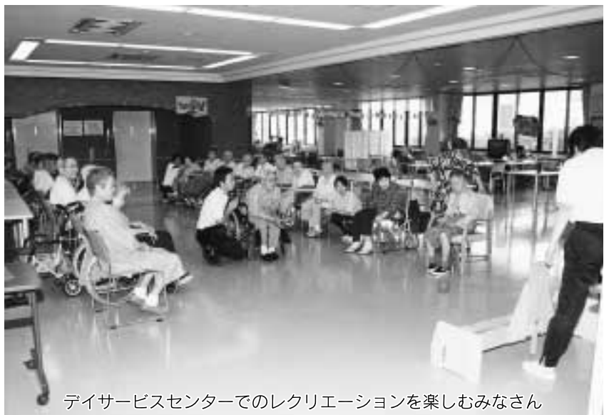
デイサービスセンターでのレクリエーションを楽しむみなさん

当日は在宅介護支援センターの職員も同席します。日ごろ介護でお困りのことや、介護サービス全般についての相談にも応じます。