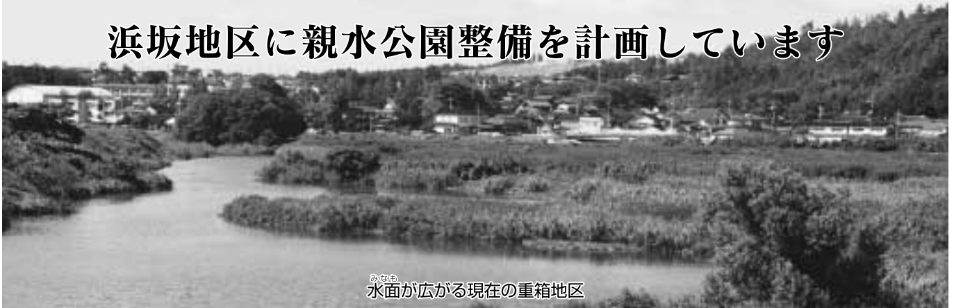
水面が広がる現在の重箱地区