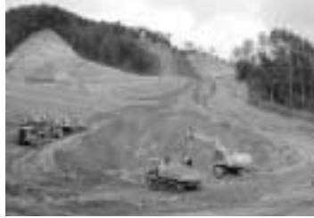
江山浄水場の用地造成(12月中旬)

このほど江山浄水場の第1期造成工事がほぼ完了。現在、水道原水に含まれるクリプトスポリジウム(以下「クリプト」という。)や小さなゴミやチリなどを取り除くための施設となる沈澱池・ろ過池(第1系列)の建設を進めており、さらに13年度内に、浄水場の第2期造成、薬品注入棟などの工事にも着手します。