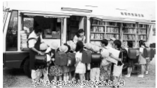
子どもたちに大人気のなかよし号