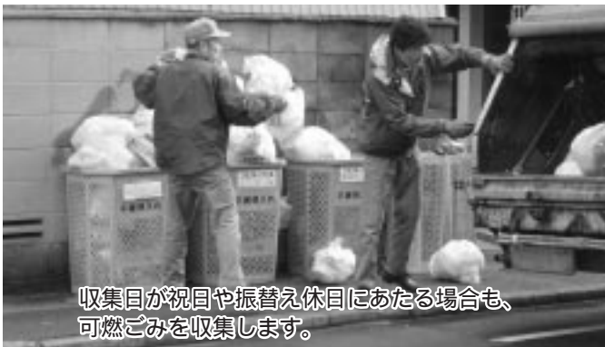
収集日が祝日や振替え休日にあたる場合も、可燃ごみを収集します。