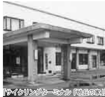
「サイクリングターミナル」砂丘の家

年四月からは、通年開館します。 問い合わせ先 「砂丘の家」 （☎29-0800）