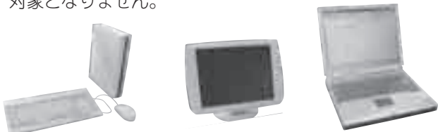
▲デスクトップ本体 ▲ディスプレイ ▲ノートパソコン